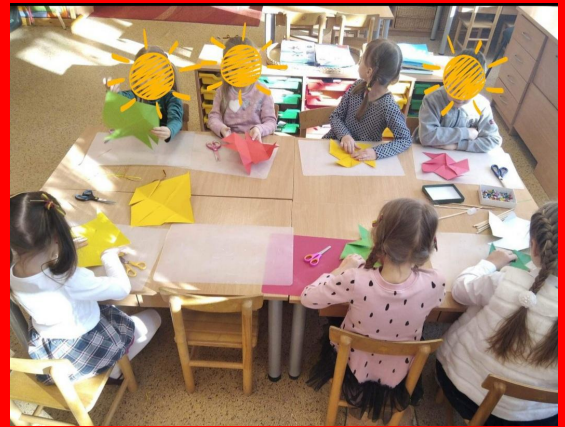
Gražiais darbais mes mylime Lietuvą